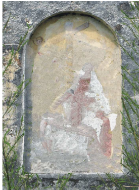
Via Marconi,7 - La Pietà'