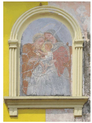
Via Barche, 16 Calonega - La Madoneta