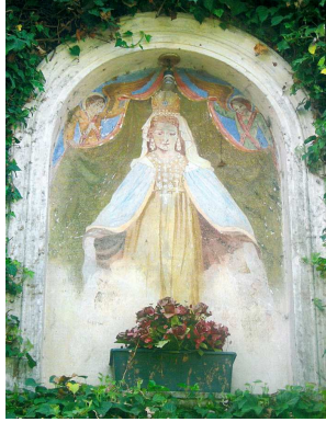
Via Calonega - Madonna Monte Berico