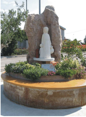
Via Brg. Julia - Madonna delle Sorgenti