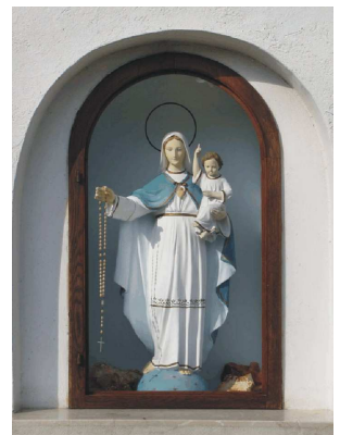
Via Poston,48 - Madonna con il Bambino