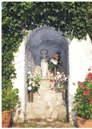
Via Albereria,20 - Grotta di Lourdes