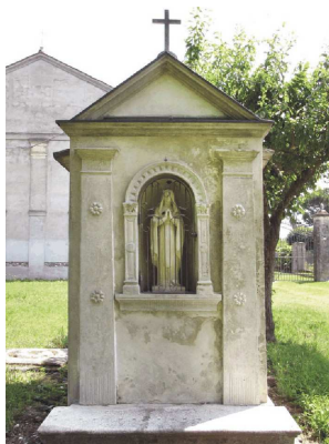
Via Roma,148 - Madonna