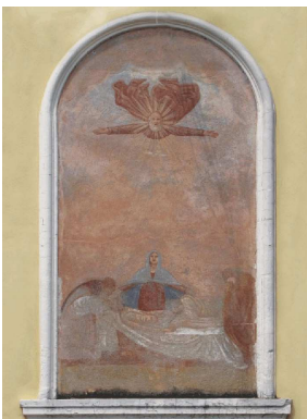
Via Nicolin,2 - Compianto di Cristo