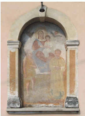
Via Tasca,28 - Sacra Conversazione