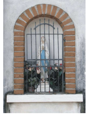
Via Albereria,19 - Madonna di Lourdes