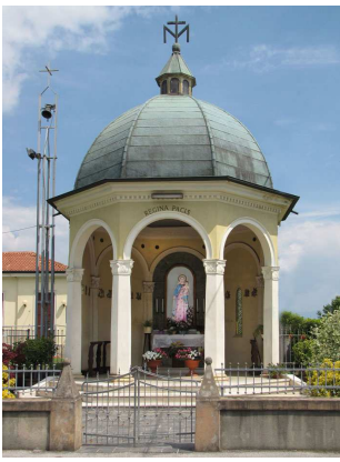
Via Barche - Madonna della Pace

I n o s t r i c a p i t e l l i d e d i c a t i a l l a M a d o n n a