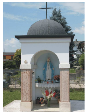
Via Comboni - Maria Immacolata