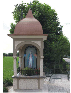
Via Molinetto - Madonna di Lourdes